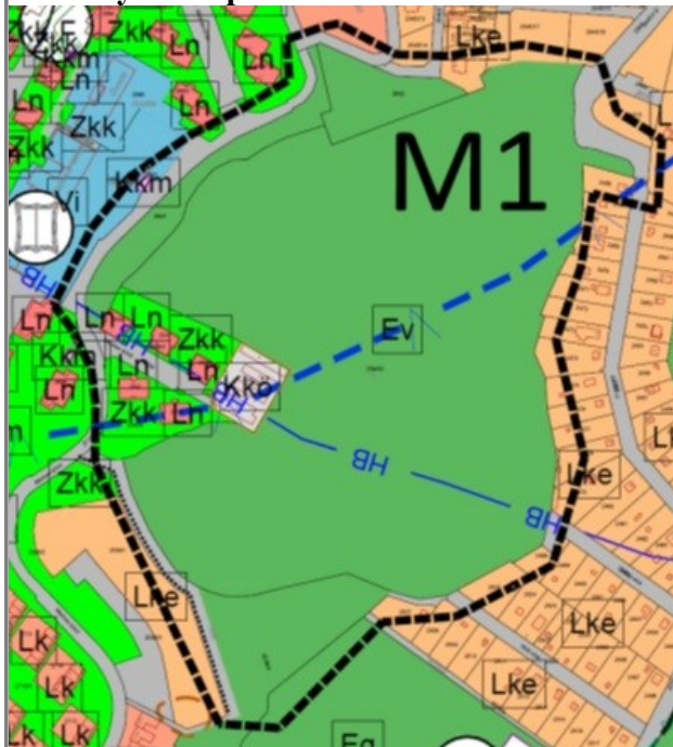
2.1. ábra Településszerkezeti tervlap hatályos F-m3, G-m3 szelvény - kivonat, részlet