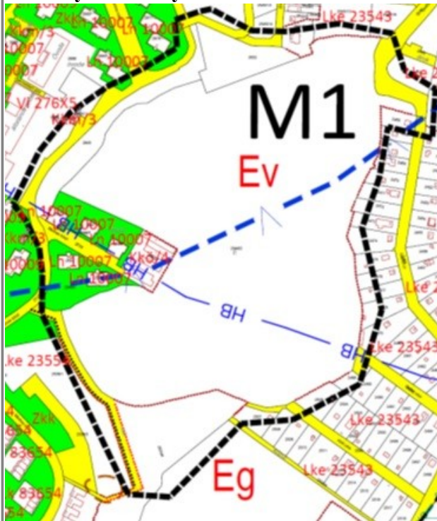
1.1. ábra Szabályozási tervlap hatályos Fd4-m2 és Gc3-m2 szelvény - kivonat, részlet