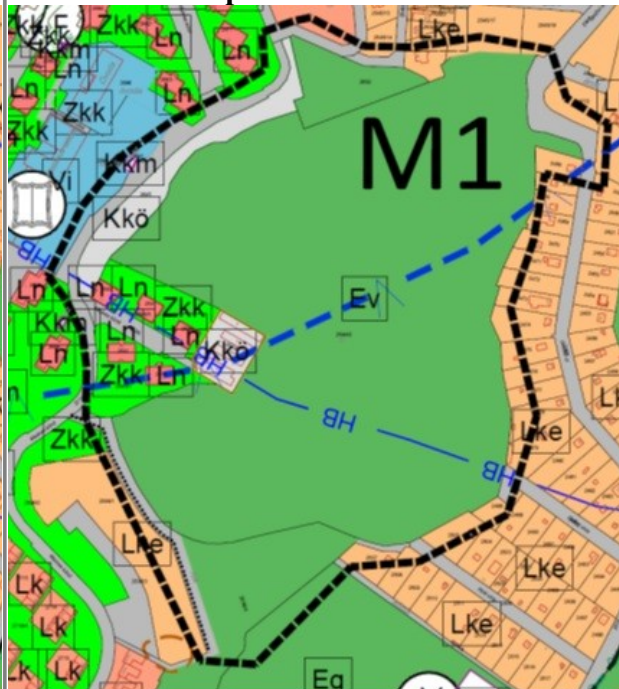
2.2. ábra Településszerkezeti tervlap tervezete F-m4, G-m4 szelvény - kivonat, részlet