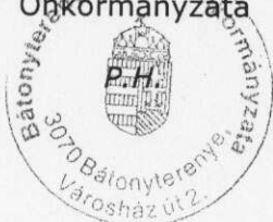
Molnár Katalin polgármester együttműködő tag