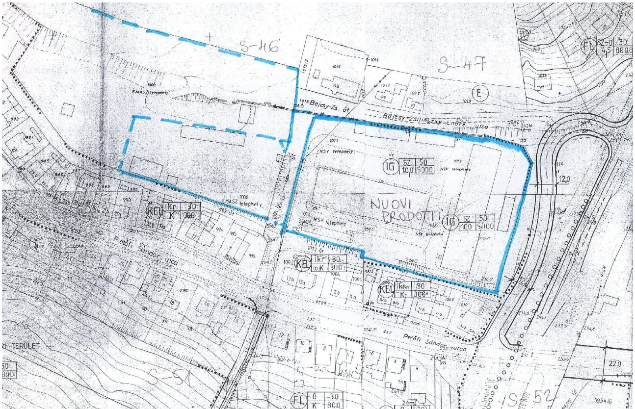
1. ábra Salgótarján Baglyasalja, Petőfi út - a szabályozási tervek részlete