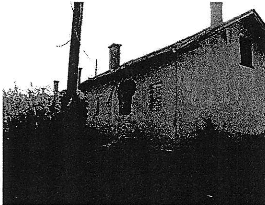
Az épület délnyugati felől 2012. szeptember 11.

A tetőfelület és a kémények csatlakozásánál a bádogg kéményszegélyek, és azok környezete kibontásra került, ez által ott folytonos beázás jelentkezik, a fa anyagú tetőszerkezetet és födémet károsítva. Szelesebb, csapadékosabb időjárás esetén azonnali áthidaló-, födém- és tetőbeszakadással kell számolni.