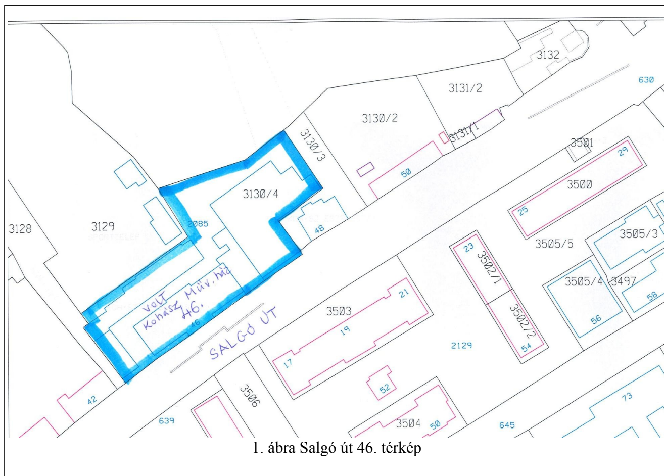
1. ábra Salgó út 46. térkép

Angyalné Wilwerger Józsa városi főépítész