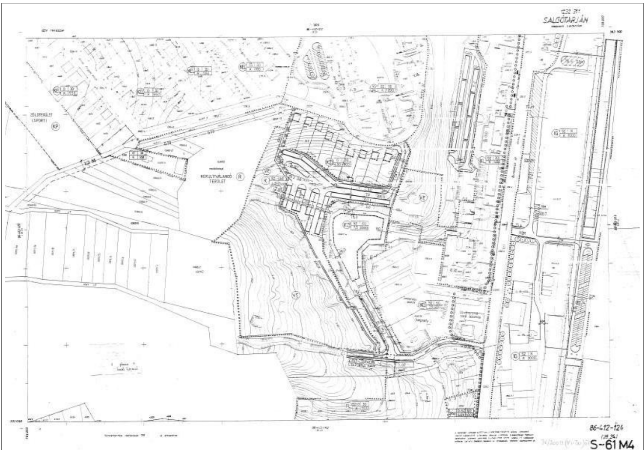
Hatályos szabályozási terv S-61 M4