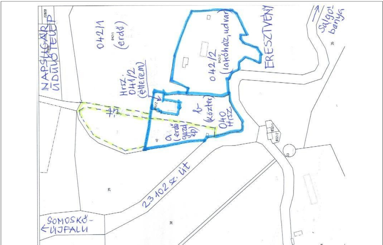
1. ábra Térkép részlete