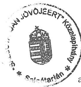
Tóth Tibor a kuratórium elnöke