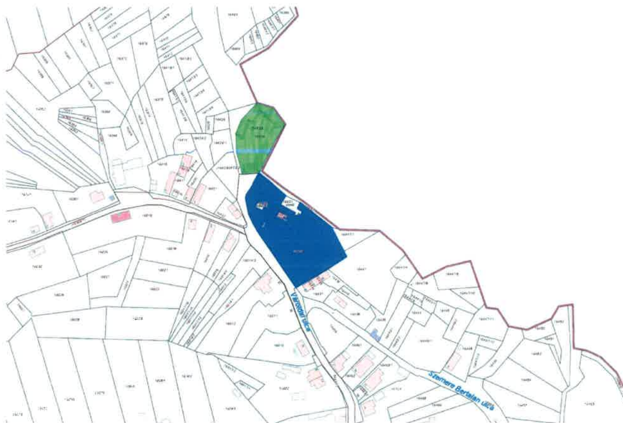
Salgótarján-Somoskő, Vároldal utca emlékliget hrsz: 16433; 16428