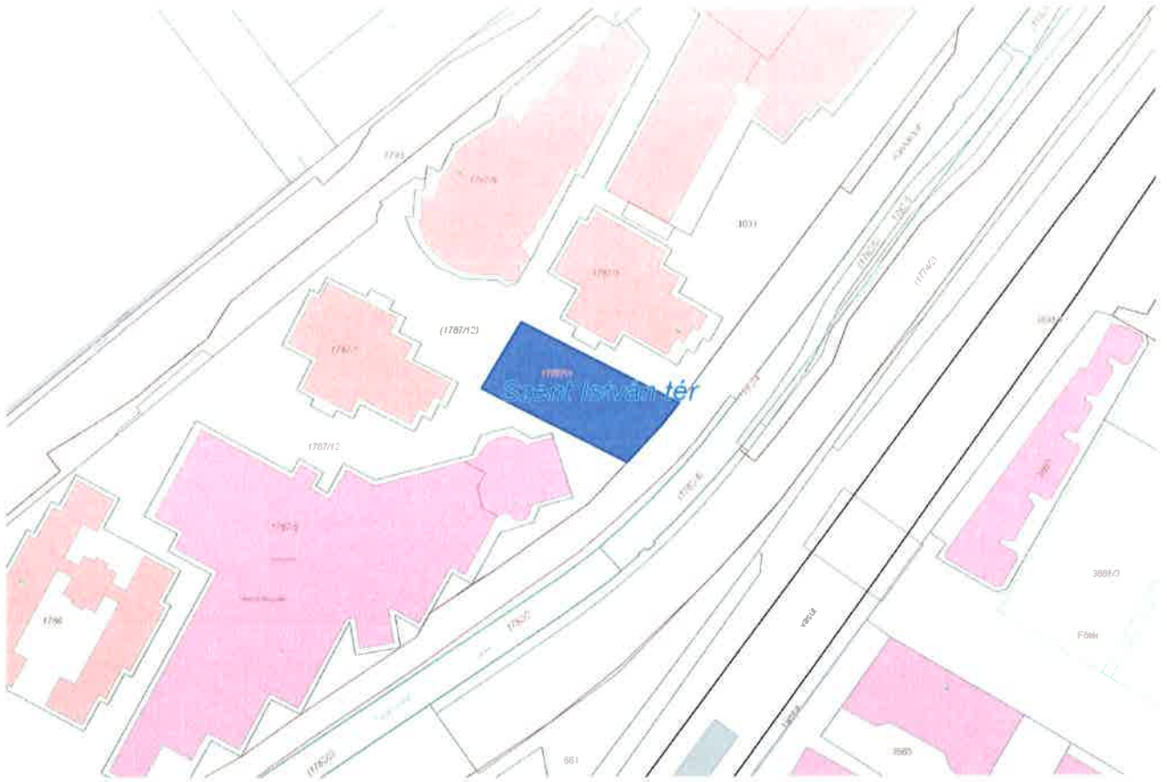
Szent István tér hrsz: 1787/11