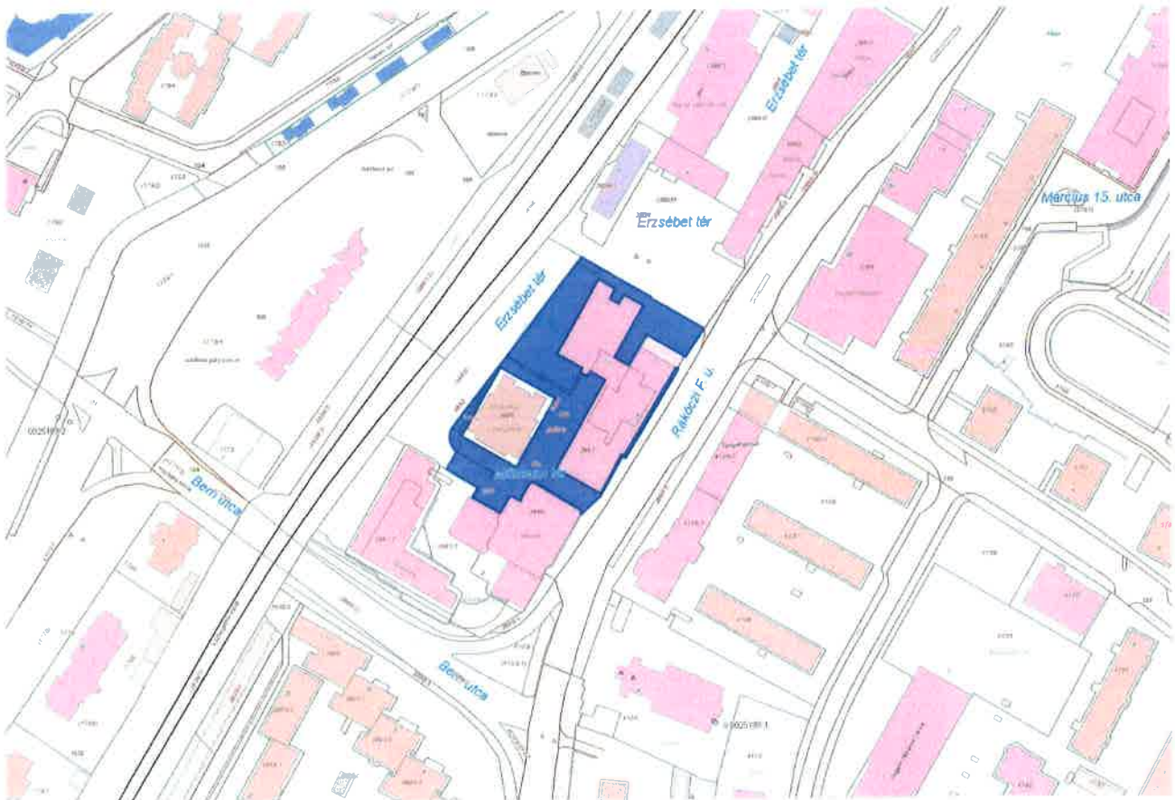
Múzeum tér hrsz: 3894