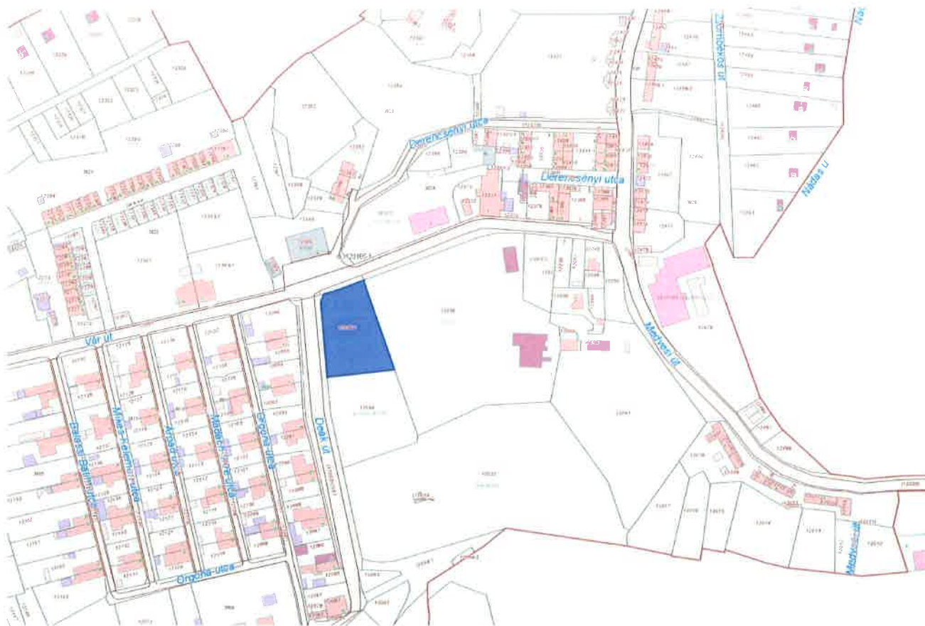
Salgótarján-Salgóbánya, Vár út emlékpark hrsz: 12035/1