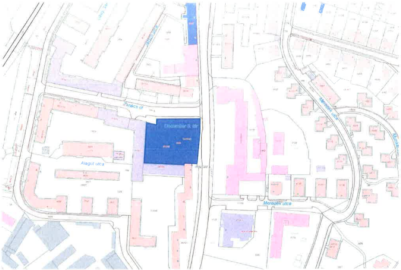
December 8 tér hrsz: 3920