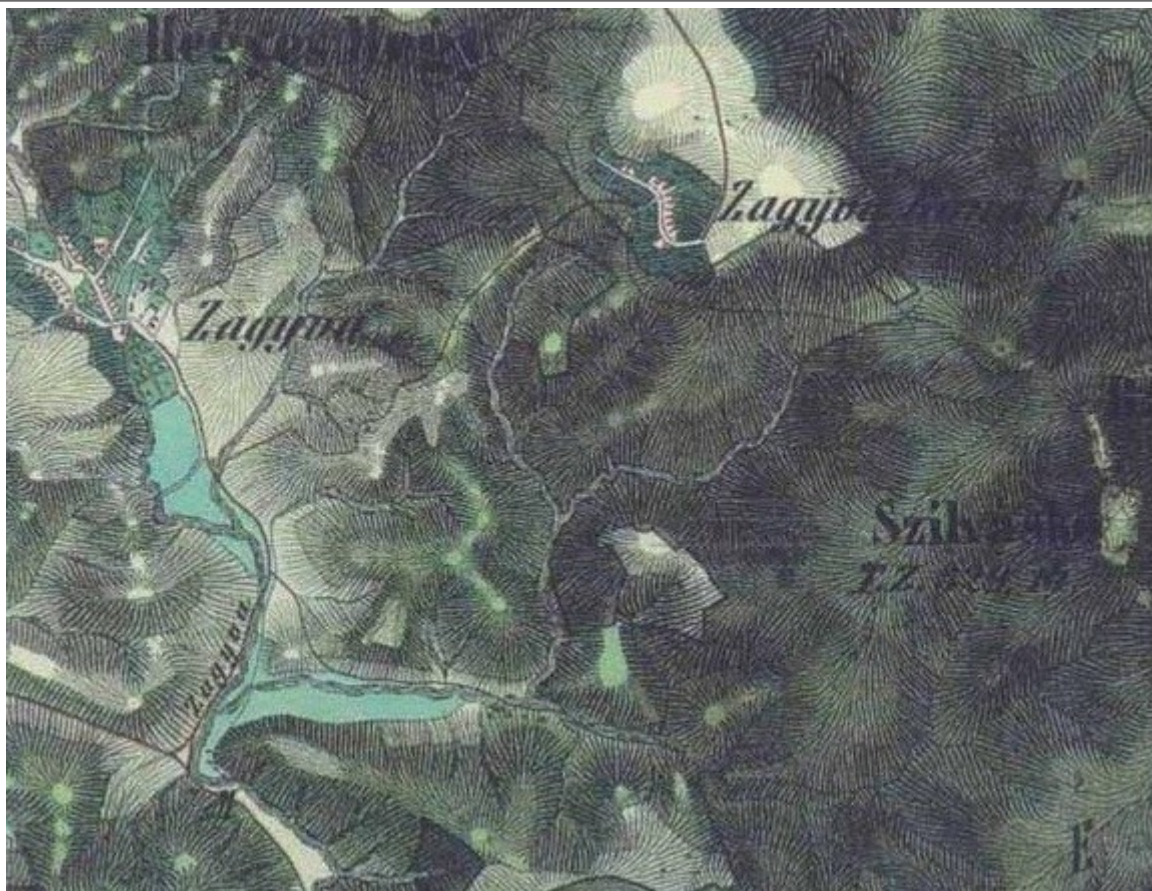
Az 1855. évi II. katonai felmérés térkép részlete Salgótarján - Rónafalu, Rónai út 11. lakóház - térképek