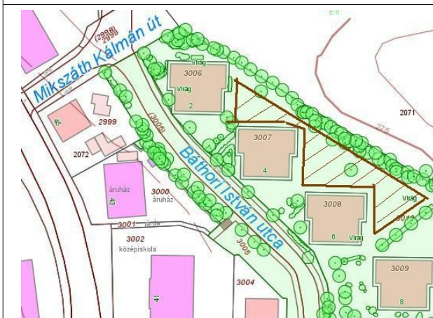
Salgótarján, Báthori István utca 2-4-6. szám mögötti 3012 hrsz. közterület (3. ábra)