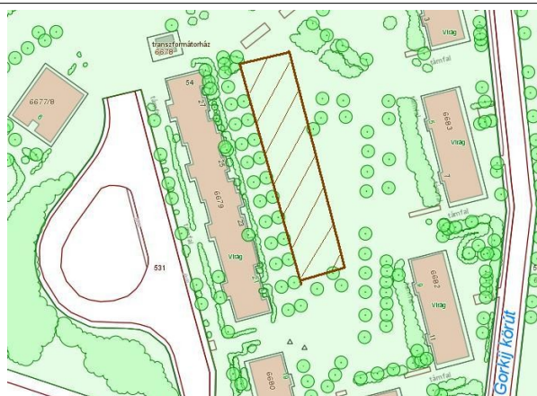
Salgótarján, Gorkij krt. 21-23-25-27. szám mögötti 6677/28. hrsz. közterület (7. ábra)