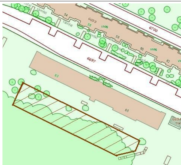
Salgótarján, Gorkij krt.85. szám melletti 6677/28. hrsz. közterület (8. ábra)