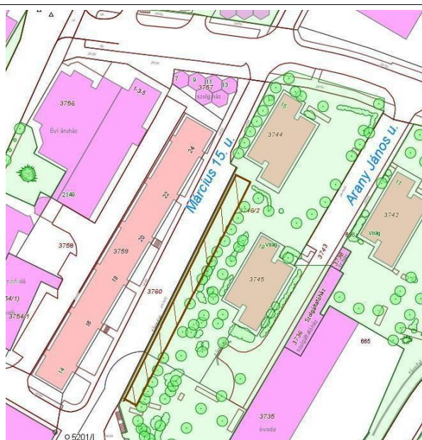
Salgótarján városközpont Március 15. út támfal feletti részén az Arany János út 19. alatti 3746/2 hrs. közterület (4. ábra)