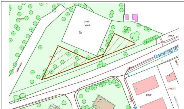
Salgótarján, Camping út tóstrand vízmű melletti 2413 hrsz. közterület (1. ábra)