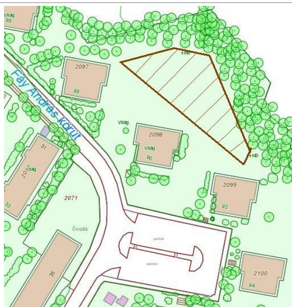
Salgótarján, Fáy András krt. 88-90-92 mögötti 2102 hrsz. közterület (2. ábra)