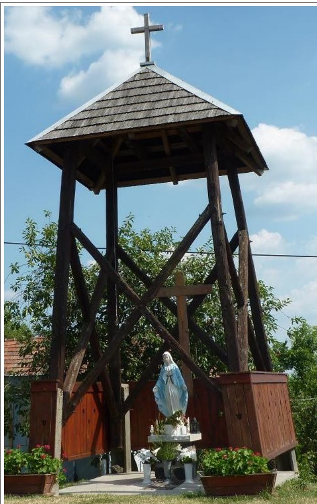
Kereszt a Madonnával 2016. 07.