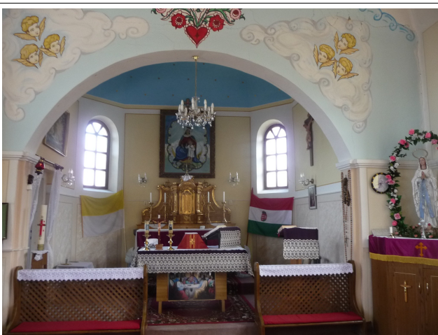
Templom belső - oltár