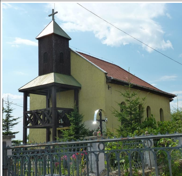
Főbejárat dél-keletről 2015. 07.