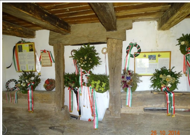
Petőfi kunyhó belülről