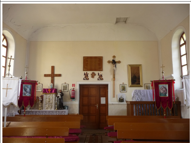
Templom belső - bejárat oldal