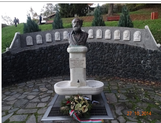
Aradi vértanúk emléke