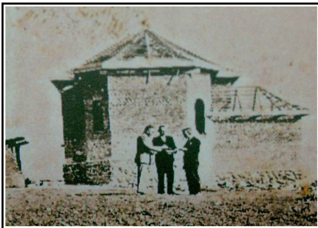
A templom építése 1940 körül