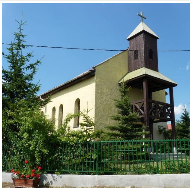
Főbejárat dél-nyugatról 2016. 07.