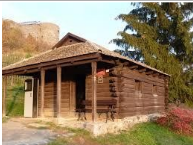
Petőfi kunyhó kívülről

Helyszínrajz és fotók a meglévő állapotról: