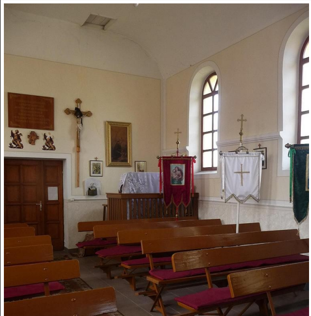
Templom belső – bejárat és oldalfal