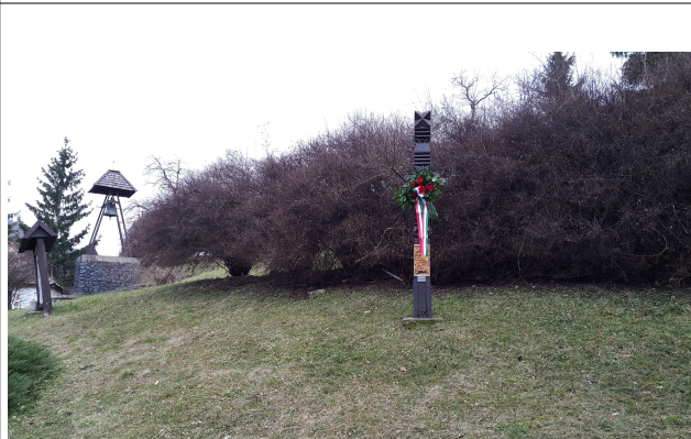
Kopjafa, háttérben a harangláb