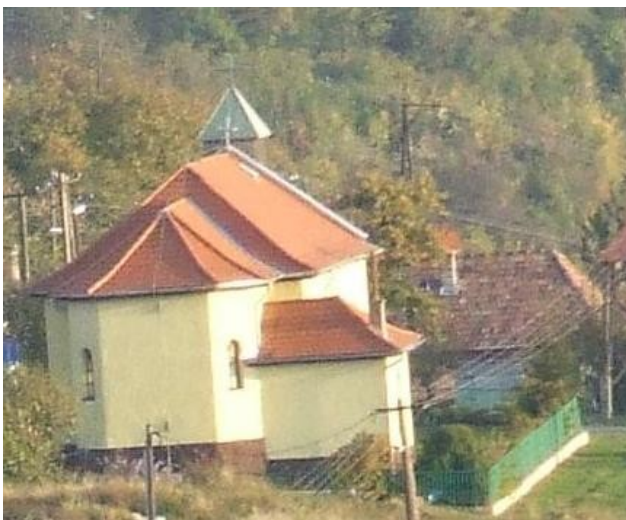
A templom nézete észak felől