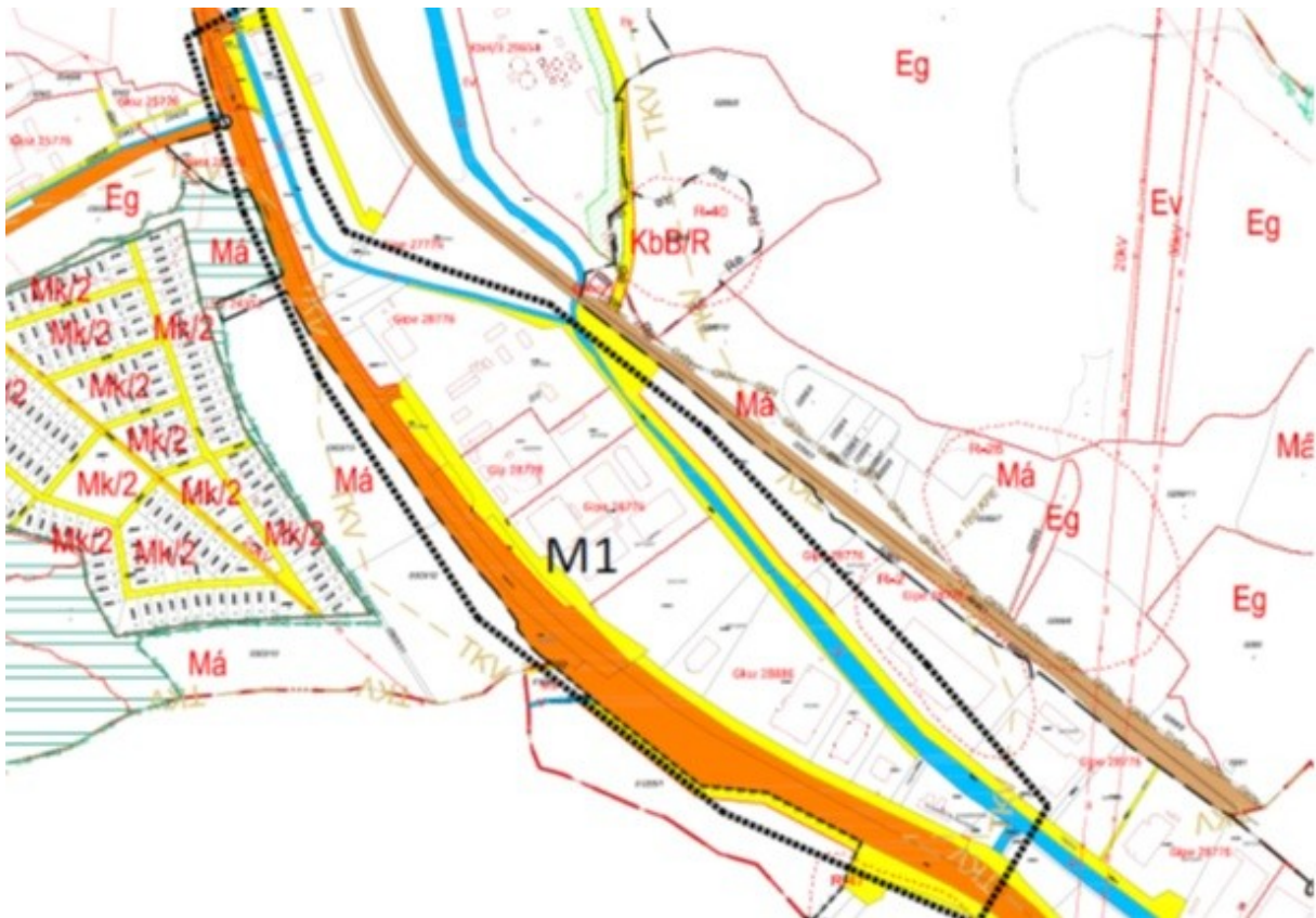
1.1. ábra A hatályos Belterületi szabályozási terv részlete Za4, Zc2

Za4 és Zc2 szelvények: A Park út mellett található 6226/18 hrsz.-ú ingatlan és környezete. A módosítás érinti az adott terület környezetét és kapcsolódó területfelhasználási egységet.