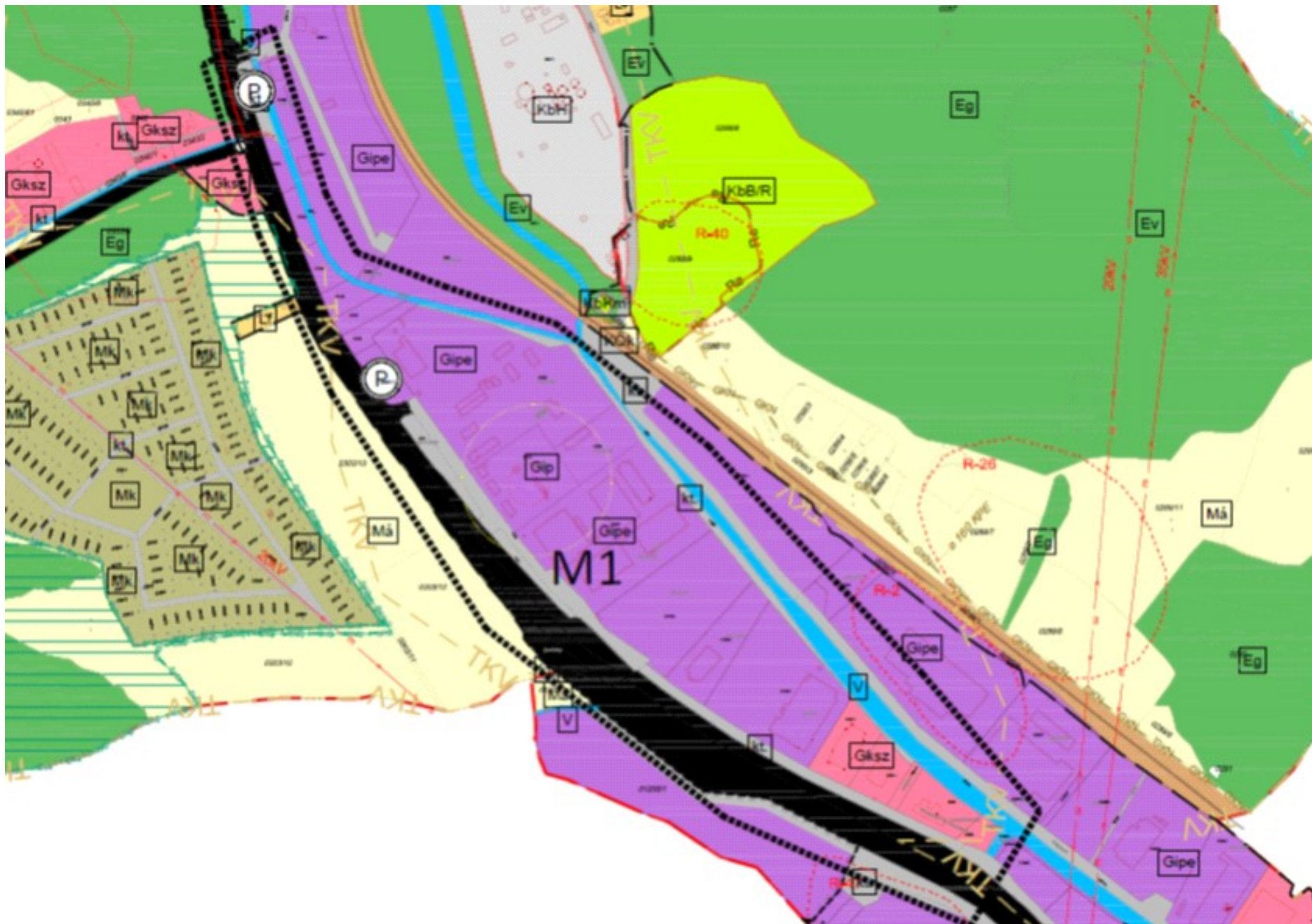
1.2. ábra A módosuló Településszerkezeti terv Z szelvény - kivonat, részlet