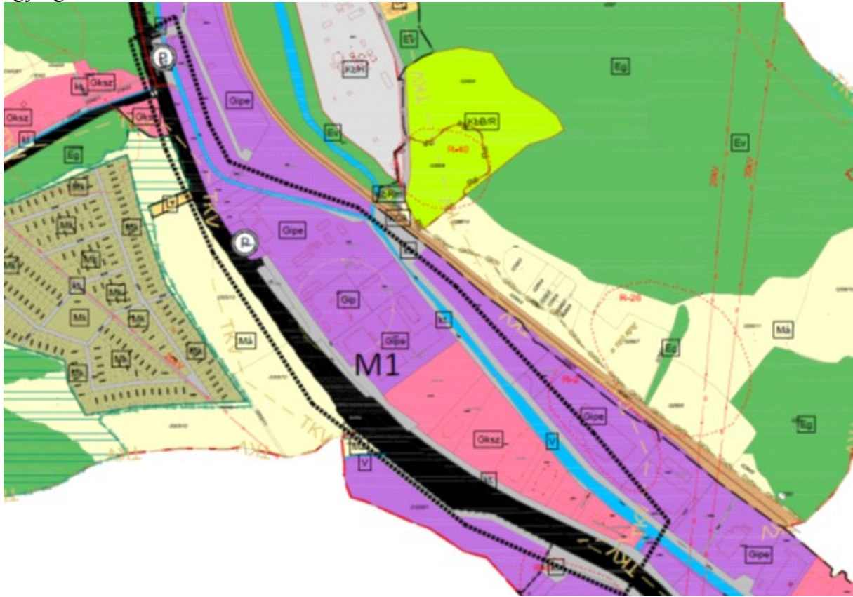
1.1.ábra A hatályos Településszerkezeti terv Z szelvény - kivonat, részlet

A Z szelvény tervlapja: A Park út mellett található 6226/18 hrsz.-ú ingatlan és környezete, illetve a módosítás érinti az adott terület környezetét és a kapcsolódó területfelhasználási egységet is.