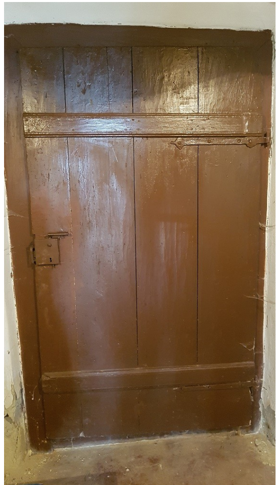
Salgótarján - Rónafalu, Rónai út 11. lakóház – külső fotók