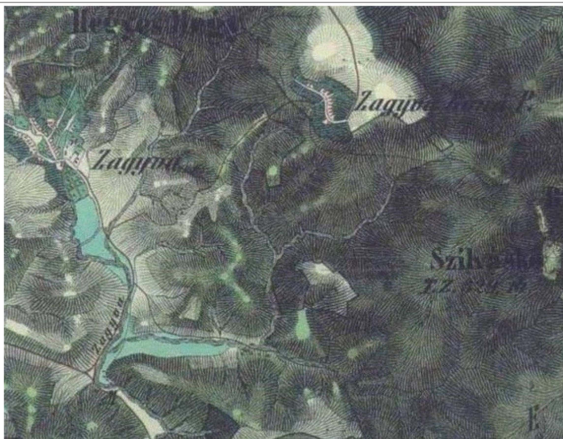
Az 1855. évi II. katonai felmérés térkép részlete Salgótarján - Rónafalu, Rónai út 11. lakóház - térképek