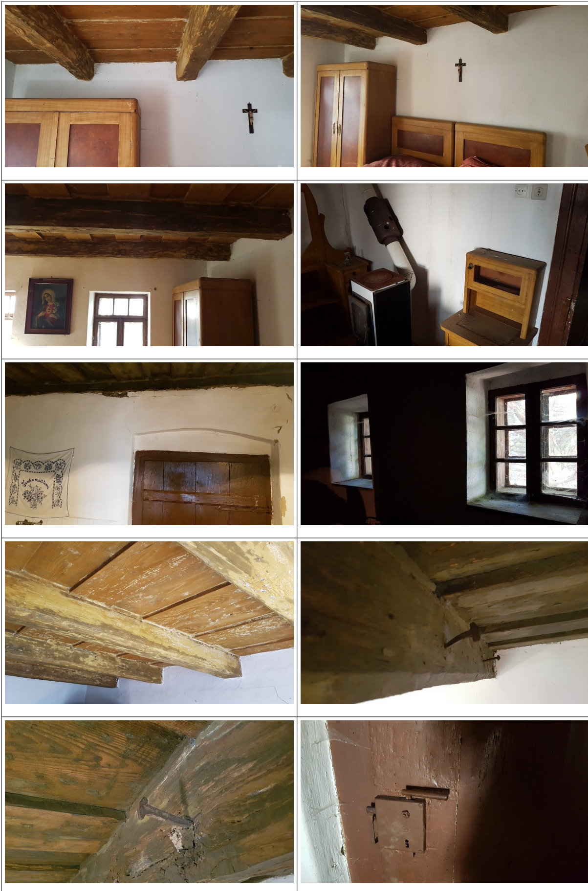
Salgótarján - Rónafalu, Rónai út 11. lakóház – belső fotók