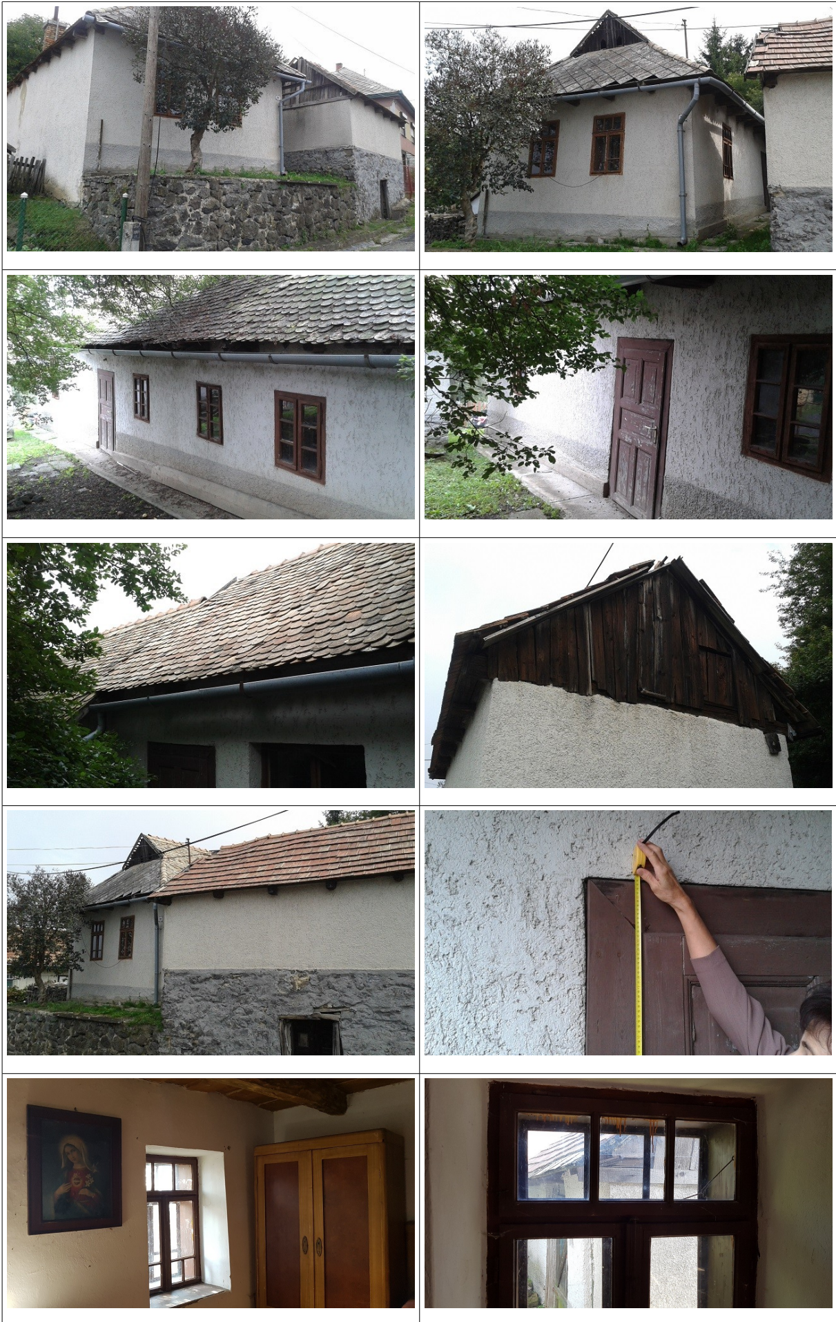
Salgótarján - Rónafalu, Rónai út 11. lakóház – belső fotók