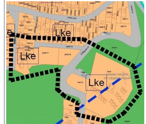
2. ábra Gedőci utcai módosítások