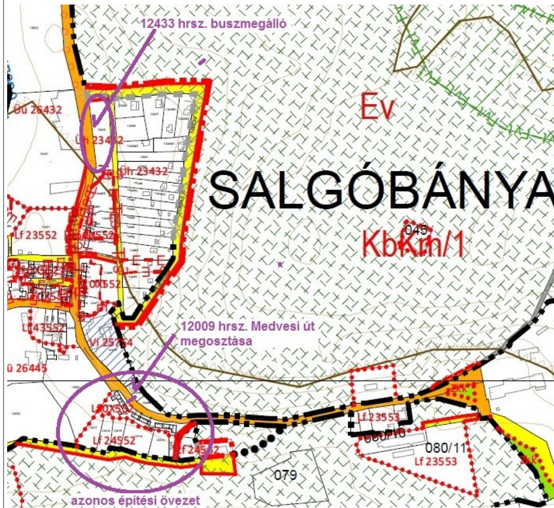
2. ábra: a Salgóbadány, Medvesi út és környezetét érintő módosítási igény: a 12099 hrsz.-ú Medvesi út tervezett megosztása állami és önkormányzati közútra, a 12433 hrsz.-ú ingatlanból buszmegálló-ingatlan kialakítása, a Medvesi út menti 12010-12031 hrsz.-ú ingatlanok azonos lakóövezetbe kerülése