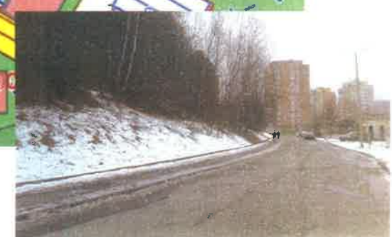
2. ábra Szabályozási terv részlete és Médves körúti fotó észak felől