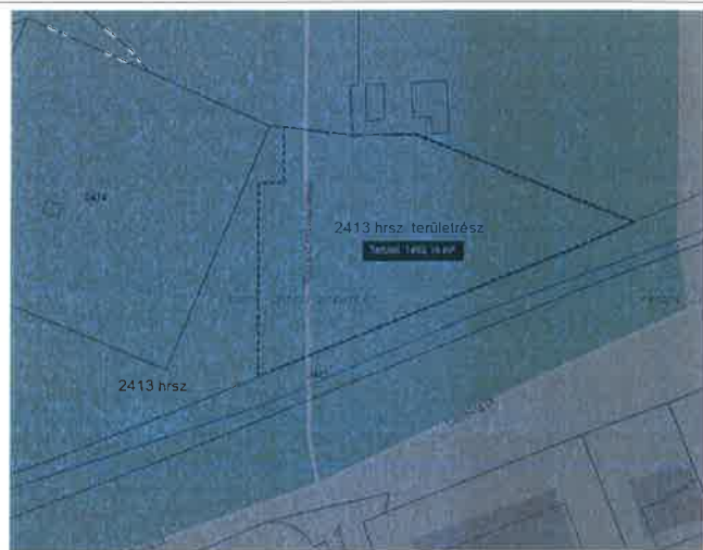
A 2413 hrsz. terülehasználat szerinti megosztása