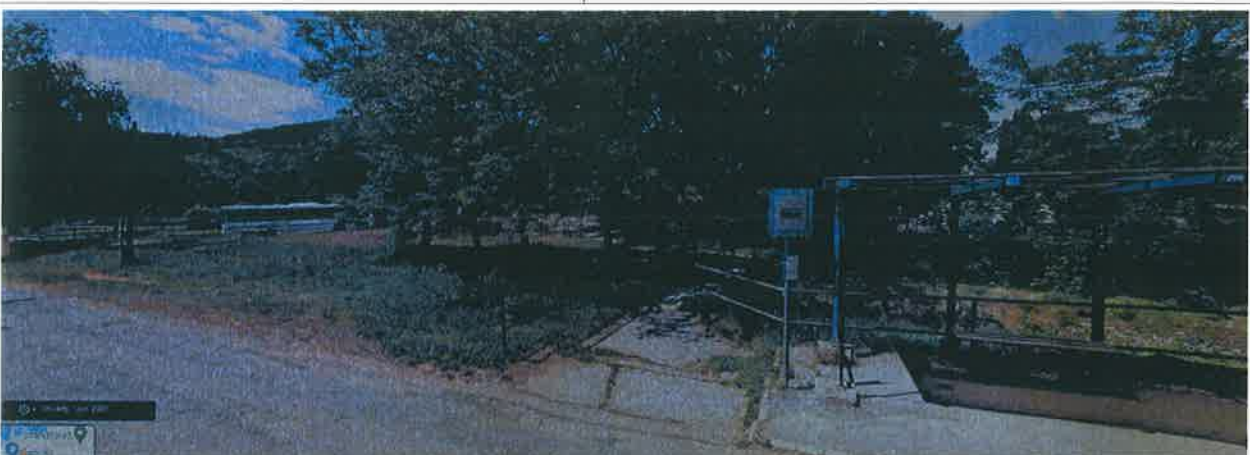
Google utcafotó, Camping úti buszmegálló és a mögötte lévő terület