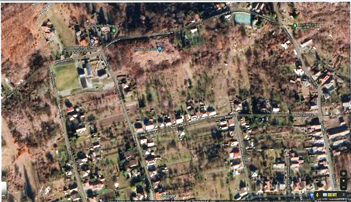
2. ábra Légi fotó