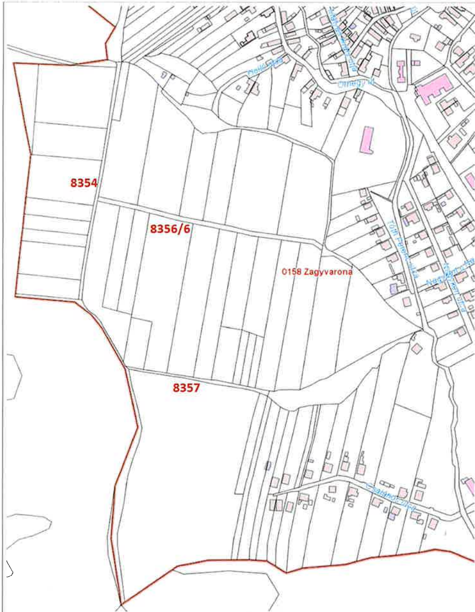
3. választókerület Zagyvaróna